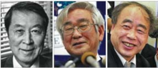
De izquierda a derecha, Yoichiro Nambu, Toshihide Maskawa y Makoto Kobayashi.

Toda la materia del universo visible está hecha de un "kit" básico de partículas