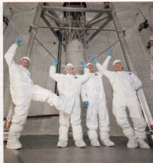
† Investigadores de LUX forman las tres letras del proyecto cuando se finalizó su construcción.