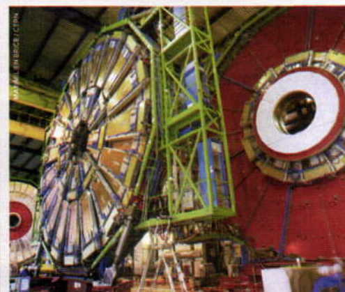
† Solenoide Compacto de Muones (CMS), uno de los dos detectores principales del CERN.