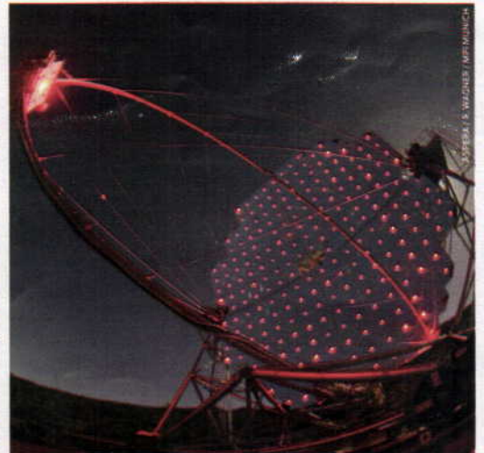
† El telescopio MAGIC, que analiza las emisiones de rayos gamma, está en la isla canaria de La Palma.

Telescopios de rayos gamma como MAGIC, H.E.S.S., VERITAS, Fermi y el módulo Alpha Magnetic Spectrometer (AMS), situado en la Estación Espacial Internacional.